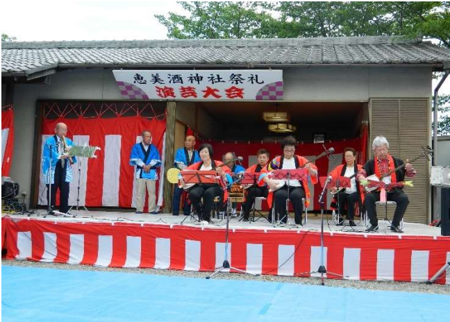
心に響いた三味線合奏