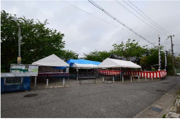
会場準備も整い多くのお客を待つ