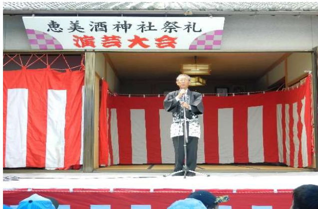
勢川自治会会長挨拶