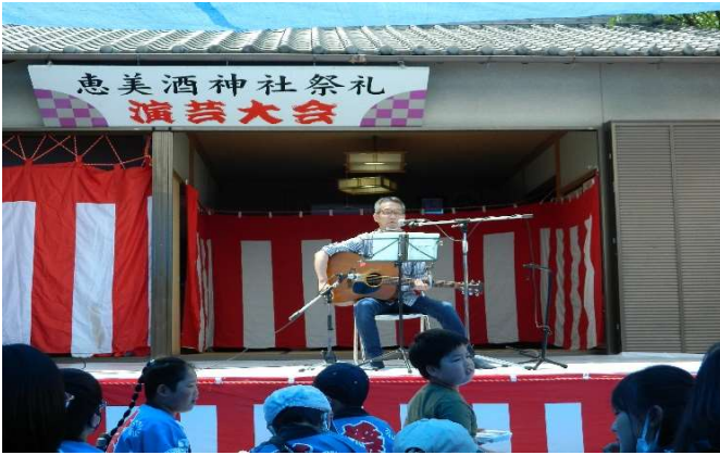
河北雅由氏によるギター弾き語り