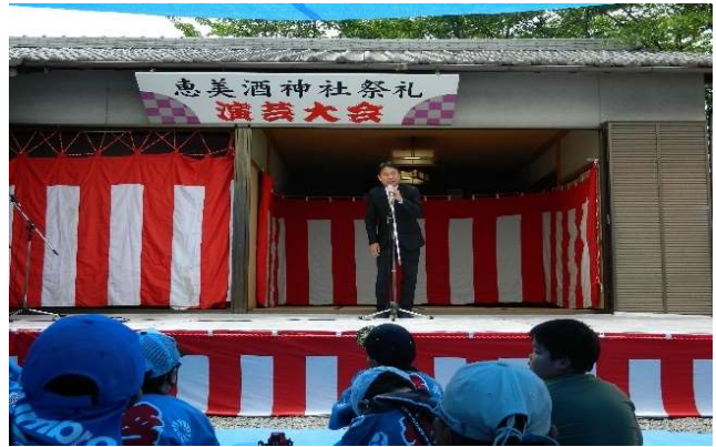
神頭市議会議員挨拶