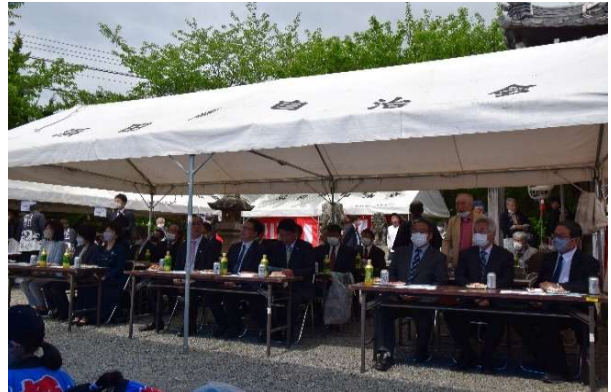
多くの来賓にご出席頂いた。