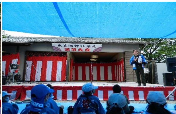
いよいよ子ども会ゲーム始まる（進行吉田）