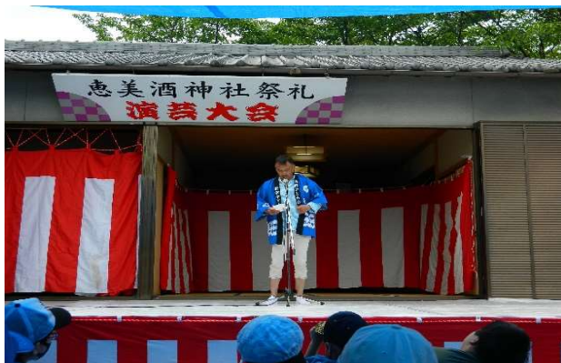
三田子ども会会長挨拶