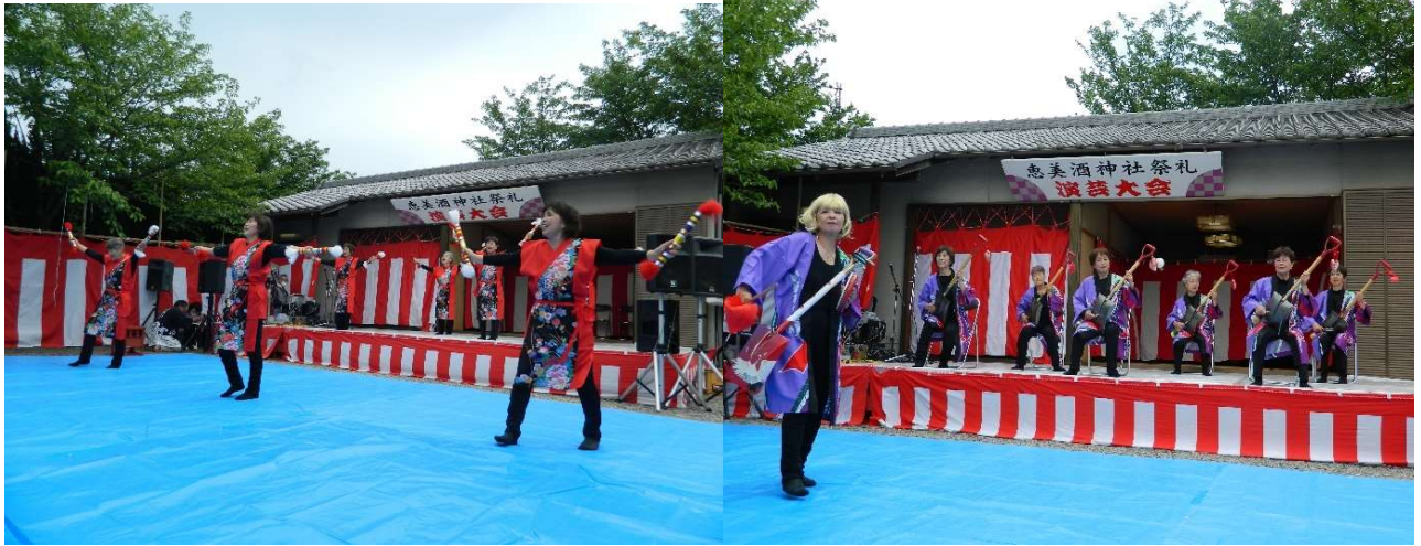
銭太鼓グループ“さくら”の踊り楽しかった（リーダー最高!!）