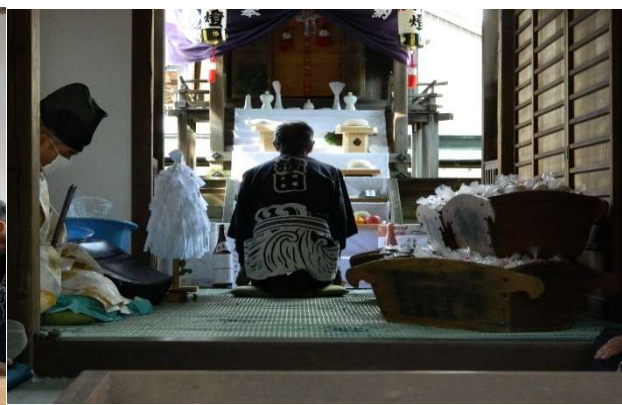
自治会を代表して安寧をお祈りする会長