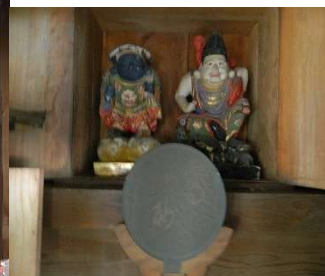
神社内のご開帳物（主祭神・配祀神）