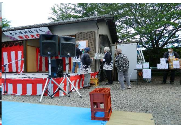
私当たったのかしら（豪華副引き抽選会）