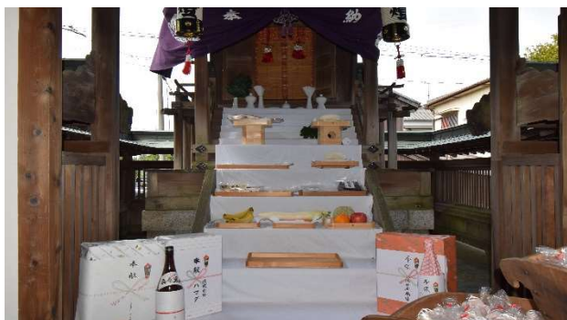
恵美酒神社へのお供え物