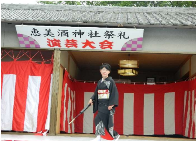
鮮やかな日本舞踊の踊り披露