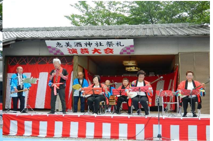
境内に響き渡った民謡（棟上げ祝い節）