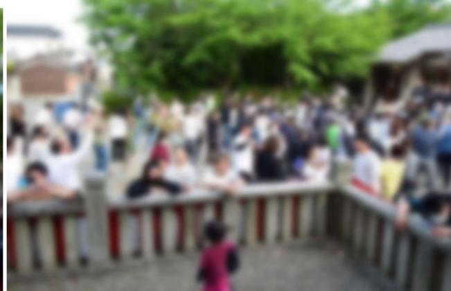
4年ぶりに楽しんだ餅まき

4年ぶりに開催した恵美酒神社祭礼行事には、多くの来賓と多くの住民が集まり楽しんだ一日で終わることが出来ました。ご苦労さまでした。次回も楽しみにしています。