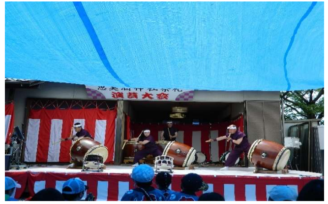
ドンドンと響き渡った一擲の太鼓