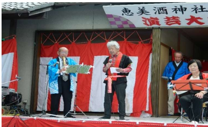
胸にジンと響き渡り聞きほれた歌声