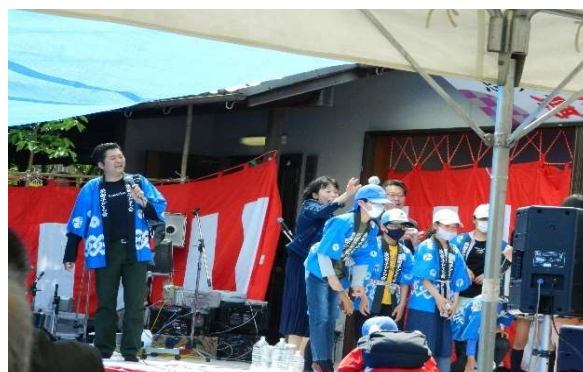
来賓続々と参加楽しんだゲーム