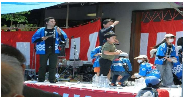
来賓も一緒となり楽しんだ子ども会ゲーム（来賓も一体となって拍手）